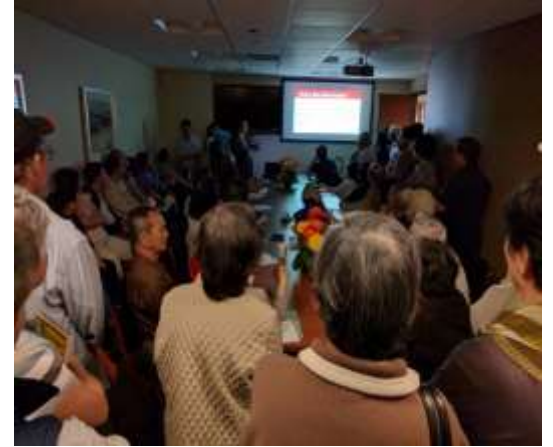
Health Fairs • Educational Seminars • Screenings • Workshops